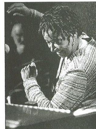
Rhoda Scott le 12 à Marguerittes.